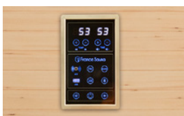
Panneau de contrôle digital dernière génération