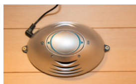
Purification de la cabine par ioniseur