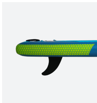
Prise de vitesse : aileron central pour une accélération rapide

Sa largeur généreuse et son long nose affilé lui confèrent des excellentes performances de glisse, en plus de sa rigidité et stabilité toutes deux inégalées. Son revêtement en EVA de qualité supérieure est un élément indispensable pour avoir des bons appuis lors des manœuvres et dans les vagues.