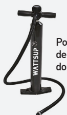
Pompe de gonflage double action