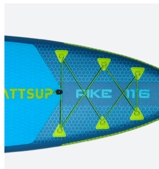
Rangement pratique : élastiques de chargement à l'avant