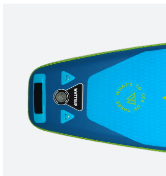
Tapis EVA ultra confort avec kick pad sur le tail