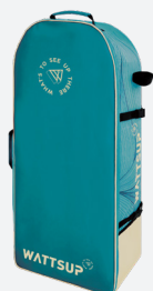
Sac de transport ultra-confort