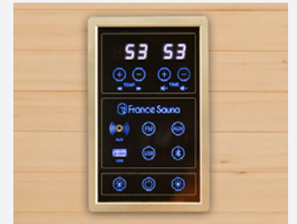
Panel de control digital de última generación