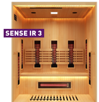
SENSE IR 3