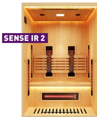
SENSE IR 2