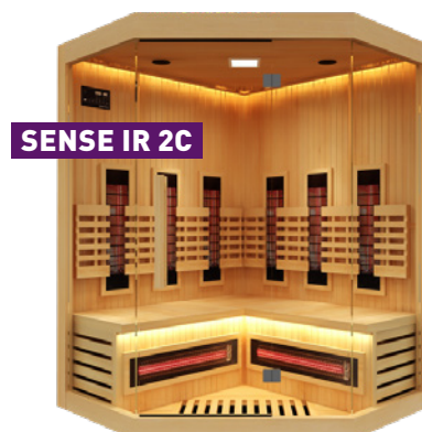
SENSE IR 2C