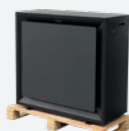
Lieferung auf Holzpalette