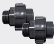
2 raccordi idraulici