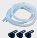
3 kit di scarico della condensa