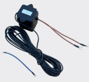
1 Relè 12 V / 230V - 30 A in dotazione