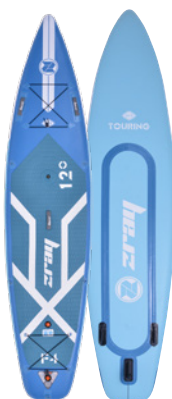
FURY EPIC 12'