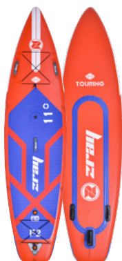
FURY PRO 11'